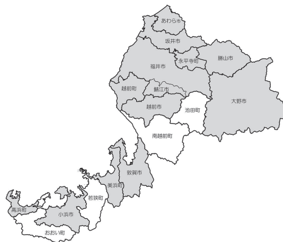
図4-1-45 騒音規制法および振動規制法に基づく規制地域