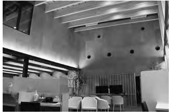
県産材で建築された民間施設（越前市）

さらに、平成29年度施行の「みんなでつかおう『ふくいの木』促進条例」に基づき、県産材の利用を進める運動を展開しており、建築士による小学校児童を対象とした木づかい塾の開催や、仁愛女子短期大学学生と連携した未就学児への木づかい体験会の開催、さらには経済団体との連携のもと、企業を対象とした木づかいセミナーや見学会を開催するなど、県産材と触れ合う機会を創出し、利用意識の醸成を図る取組みを行っています。