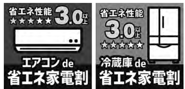
省エネ家電割アイコン