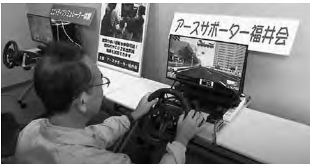
エコドライブシミュレーターを用いたエコドライブ体験

県では、地域や家庭において地球温暖化防止に向けた取組みを推進する「アースサポーター」（地球温暖化防止活動推進員）を委嘱しています。現在約30名のアースサポーターが各地域で自らが率先して地球温暖化防止の取組みを実践するとともに、温暖化に関する情報提供や意識啓発、地域での活動の推進などを行っています。