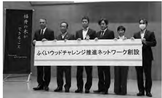
「ふくいウッドチャレンジ推進ネットワーク」の創設

本ネットワークにより、オフィス家具や名札・名刺など身近なところでの利用や社屋等の木造・木質化、県産材を利用した商品開発など、「企業のウッドチャレンジ」を推進しています。