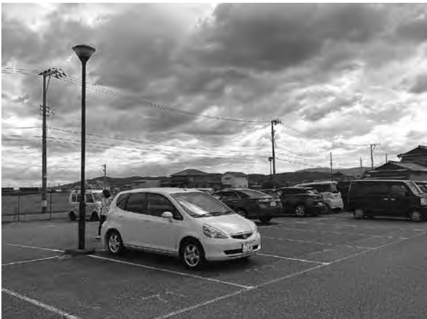
県営パークアンドライド駐車場(西長田駅駐車場)