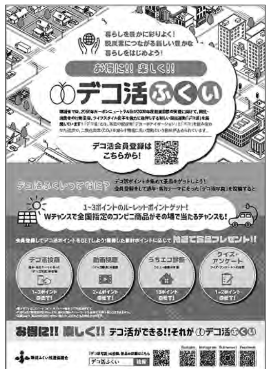
デコ活ふくいのポスター

デコ活ふくいの開始に伴い、専用WEBページを開設しました。デコ活ふくいWEBページでは、環境に配慮した行動をとり、その写真を投稿する機能や動画の掲載、アンケート機能など、複数のコンテンツ用意し、県民の省エネ活動を推進しました。