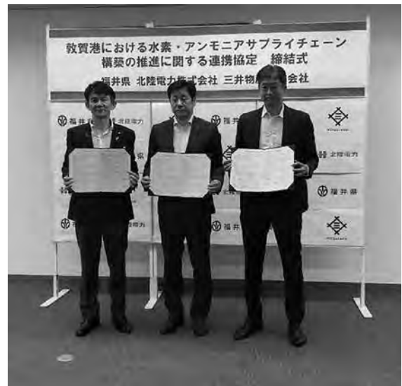
民間企業との協定締結式

具体的には、敦賀港周辺の民間事業者に対する燃料電池フォークリフトの貸出しおよび水素供給の実施や、嶺南地域の民間事業者に対する水素関連機器の導入診断を実施しています。さらに、市町や民間事業者と協定を締結し、おおい町における水素製造・供給実証施設の整備や、敦賀港におけるアンモニア浮体式貯蔵再ガス化装置（FSRU）を用いた水素アンモニアサプライチェーン構築に向けた調査を進めています。