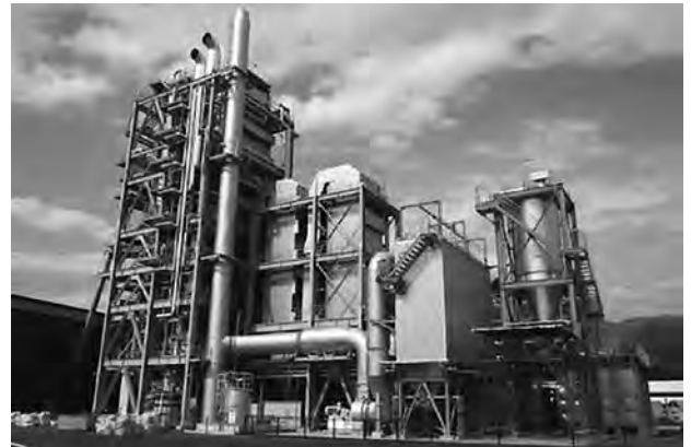
木質バイオマス発電施設（大野市）

このほか、あわら市の温泉施設では、地域の民間企業等で構成する法人が主体となり、6台の木質バイオマスボイラーを導入し、地域ぐるみで熱利用に取り組んでおり、地域資源と経済の循環が図られています。