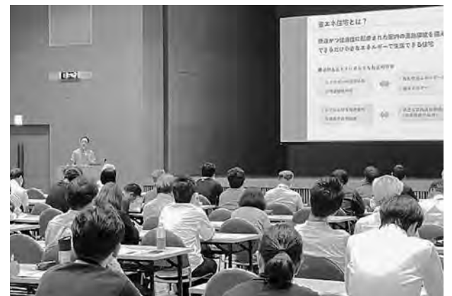
事業者向け講習会の様子

県では、県民からの省エネ住宅に関する相談に対応できる民間事業者の育成に取り組むため、令和4年度から講習会を開催しています。