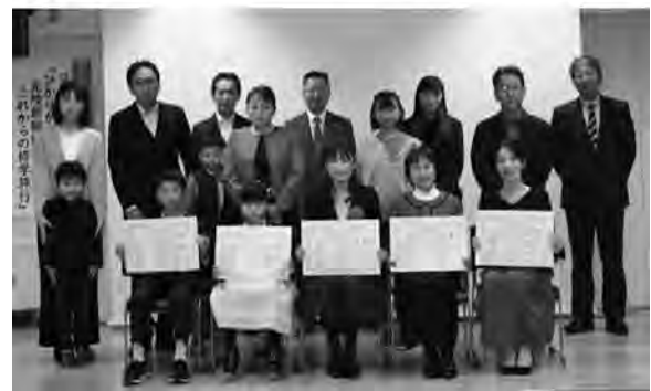
「幸福」エピソード募集・応募作品、表彰式の様子

このほか、自転車無料点検会の実施やカーフリーデー等への出展、メルマガの配信などに取り組んでいます。