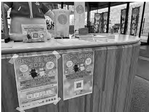
ウォームシェアスタンプラリー