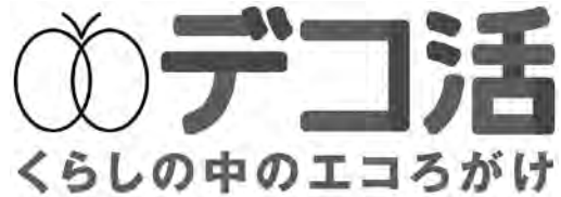
「デコ活」のロゴマーク

ロゴマークは一人一人の日常の取組みが地球を変える大きなうねりになるという意味を込めて「バタフライエフェクト」をイメージし、蝶のデザインになっています。