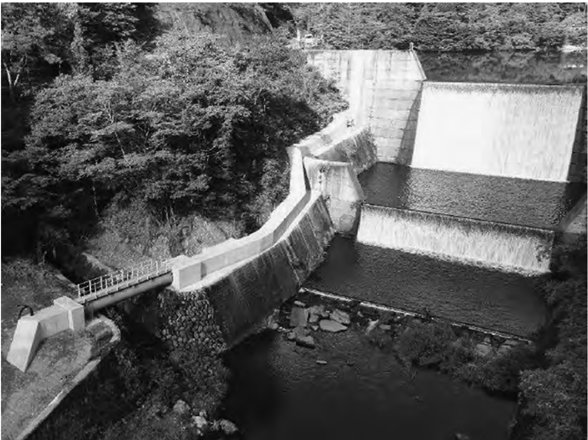
再エネ活用地域振興プロジェクト事業の支援を受けて建設された小水力発電所（おおい町）