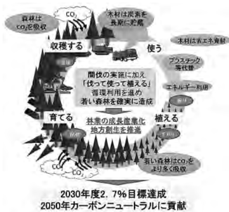
図2-2-4 森林の循環利用の推進

令和3年10月に改定された「地球温暖化対策計画」では、令和12年度において約3,800万CO 2 トン(2013年度総排出量比約2.7%)を森林吸収量で確保することを目標としており、適切な間伐* 2 実施に加え、木材の利用拡大や成長に優れたエリートツリー等の苗木による再造林などに取り組むこととしています。