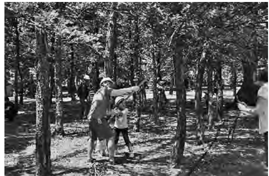
「みどりと花の県民運動大会」親子育樹体験

また、次世代を担う「緑の少年団」や県民誰もが、自然を知り、森林や緑の大切さを学ぶことができる活動場所とするため、福井市脇三ヶ町にある県有林を「体験の森」として整備し、森林環境教育活動を推進しています。