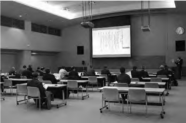
エネルギー関連技術シーズ紹介セミナー（IR交流会）の様子 （ふくいオープンイノベーション推進機構）

また、「ふくいオープンイノベーション推進機構」では、県内企業のエネルギー分野への新規参入や産学官連携の参考として、県内企業、大学等有する技術シーズをまとめたエネルギー関連技術シーズ集を公開しています。