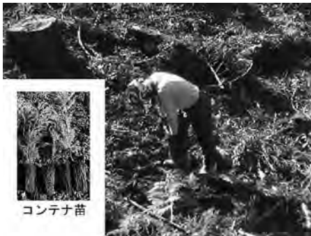
コンテナ苗を活用した主伐後の再造林