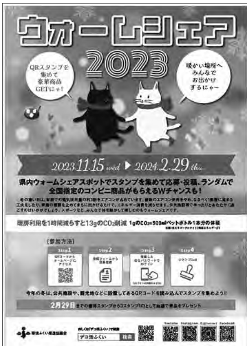
ウォームシェアのポスター

冬の期間、暖かさをシェアする取組み「ウォームシェア」推進のため、暖かく過ごせる場所を登録・周知し、QRコードを用いた非接触型スタンプラリーを実施しながら、冬場における家庭の消費電力削減を促しました。(ウォームシェアスタンプラリー実施期間は11月15日～2月29日)