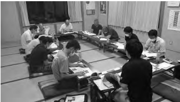
地域住民を対象とした治山事業の説明会

また、森林に起因する災害を未然に防止するため、中山間地の集落に山林保全（山地災害および山林買収）監視モニター（R5：1,193名）を配置するとともに、地域住民を対象とした治山事業の現場見学会等を開催し、治山工事の目的や効果、山地災害が発生する予兆、避難の大切さ等を再認識してもらうことで、防災意識の向上と普及啓発にも努めています。