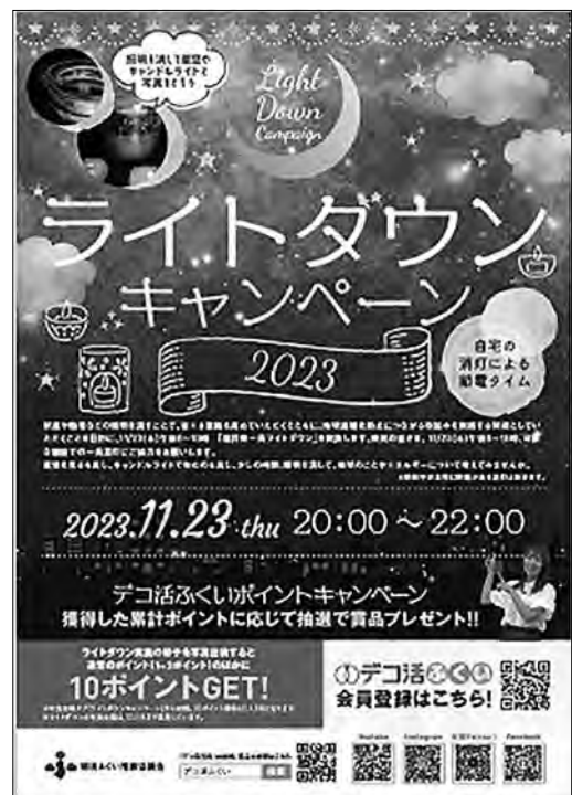
ライトダウンキャンペーンのポスター

ふるさと環境フェア開催日と同日の11月23日を一斉ライトダウン実施日として設定し、20時～22時までの間の消灯およびライトダウンの様子を撮影した写真の投稿を呼びかけました。照明を極力消して過ごすことで節電によるCO 2 削減を推進しました。