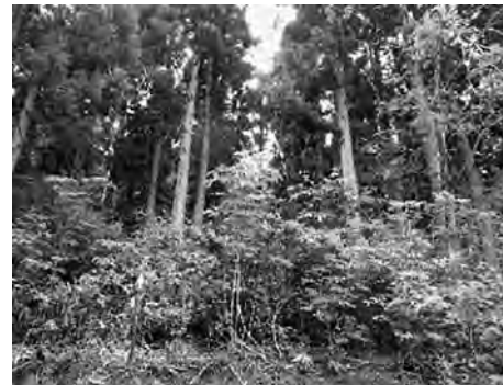
列状間伐施行後の広葉樹導入状況

また「環境保全の森」では、奥山の人工林を中心に、列状間伐等により広葉樹の導入を促し、針広混交林化や広葉樹林化を進めます。