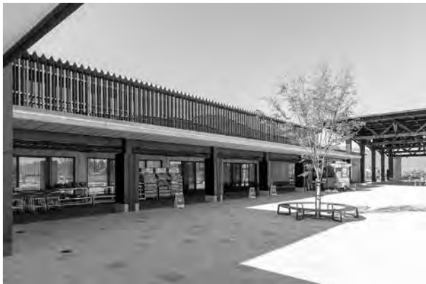
ウッドプラスチックのルーバー（大野市）

ウッドプラスチックは間伐材由来の木粉と合成樹脂からなる複合資材で、木材の温かみを持ちながら、合成樹脂の耐久性、成形性を兼ね備えており、県内外の公共施設や商業施設において、デッキやルーバーなどの外構材として使用されています。