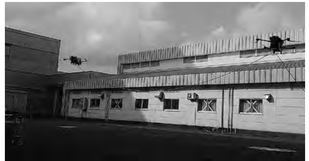
複数ドローンによる飛行試験の様子

また、布帛に搭載可能な太陽電池に関する研究も行っており、実装に適した太陽電池の電極とテキスタイル製の電極を接続する技術を開発しています。