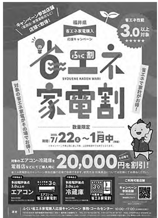
省エネ家電割チラシ