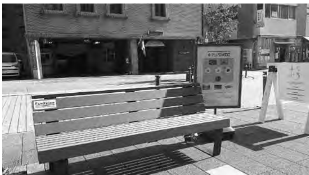
ウッドプラスチックのベンチ（福井市）

平成28年4月に稼働した大野市七板の木質バイオマス発電施設（発電規模7,000kw級）は、年間約12万 \text{m}^3 の木質バイオマスを燃料としており、化石燃料代替による二酸化炭素の低減に加えて、燃料の地産地消による林業の活性化や地元雇用の創出など地域に貢献した施設となっています。