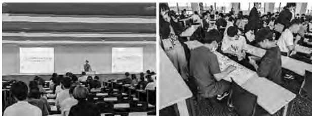
大学講義で公共交通カードゲームを活用

令和5年度は、公共交通の大切さや必要性について自分事として考えてもらうため、県庁若手職員が作成した公共交通カードゲームを活用し、大学の講義や児童館、イベント等に出向き、遊んで学べる機会を設けました。