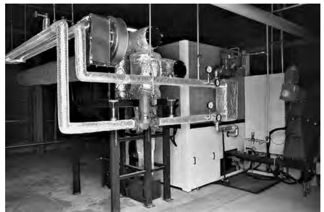
温泉施設に設置された 木質チップボイラー（あわら市）