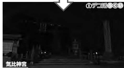
ライトダウンの様子（敦賀気比神宮）