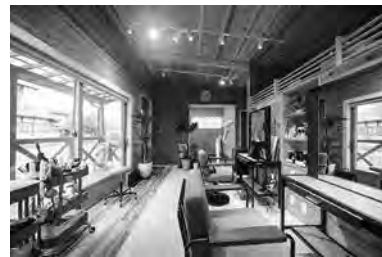
県内の木質化の事例

「木を使った内装で居心地のいい空間を創出したい」「SDGsの取組みとして、木製の机を検討したい」など、木質化に関する相談を受け付けています。空間づくりの専門家であるインテリアコーディネーターが解決のお手伝いをしています。