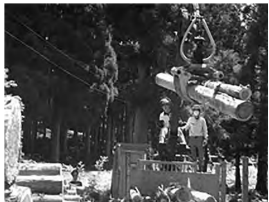
ふくい林業カレッジ 高性能林業機械の操作研修

また、令和2年度からは、早期就業希望者に対し、伐倒技術の習得や資格取得を中心とした3カ月半の短期コースを新設し、新たな人材の確保に取り組んでおり、令和4年度末までで合計58名が研修を終了し、現場で活躍しています。