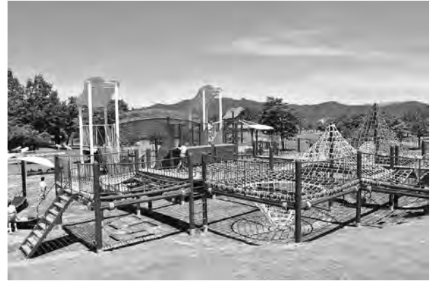
奥越ふれあい公園

本県における都市公園は、令和3年3月末現在、13市町（9市4町）において941か所、面積1,199haとなっています。都市計画区域人口一人当たりの面積は、17.5㎡（全国平均12.5㎡）であり、全国第12位の整備水準です。