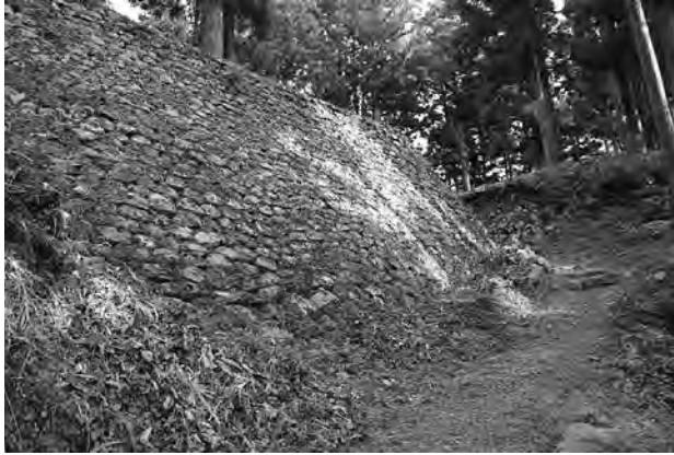
国名勝おくのほそ道の風景地に追加指定された湯尾峠