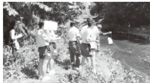
地元中学校科学部との合同水質調査の様子 (R1.8)