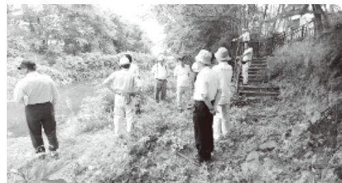
地元の方との合同現地調査の様子 (R1.7)