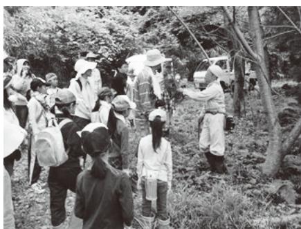
フォレストサポーターの活動の様子

今後も、子どもたちに対して、魅力ある森林環境教育を行い、多様な森林体験の機会を提供しながら、将来、福井県の森林・林業を担う後継者、指導者として活躍してもらうことを期待しています。