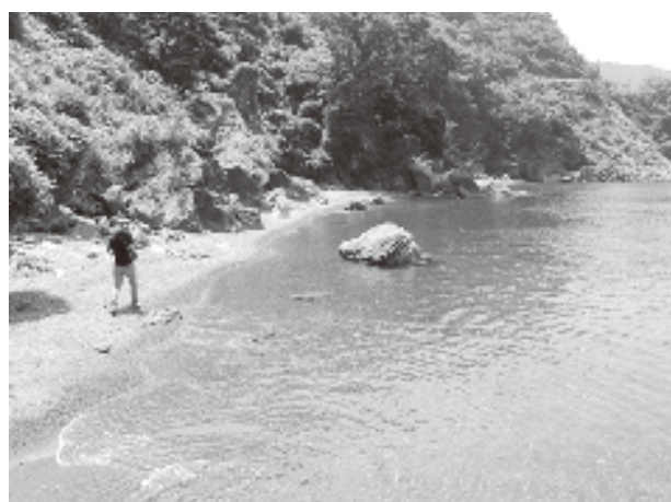
若狭町世久見（砂浜の先に遊歩道が続きます）

これらの施設のなかでも特に、本県の自然公園の特色でもある風光明媚な海岸線や湖などに沿ったルートやこれらの景色を眺望できるルートを「里海湖トレイル」として、利活用の促進に努めていきます。