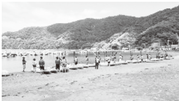
教育旅行でのシーカヤック体験の様子

学生の長期宿泊体験を推進する「子ども農山漁村交流プロジェクト」がスタートしました。本県では、若狭町、美浜町が受入れモデル地域に採択され、大敷網などの漁業体験、そば打ち、魚の調理などの食体験を実施しました。また、農山漁村地域における令和2年度の体験旅行受入は、新型コロナウイルス感染症（COVID-19）（以下、新型コロナウイルス感染症という）拡大の影響もあり、県全体で前年度に比べて500名程度減少し、約14,400名の受入となりました。県内の小中学校を中心に小浜市で約2,200名、池田町で約6,700名の受入れがありました。