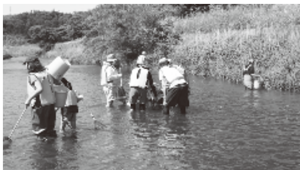
三方五湖自然教室 はす川の魚を観察しよう (R3.5.30)

また、県自然保護センターでは、自然観察会や天体観望会等を、県海浜自然センターでは、海のふれあい教室や三方五湖自然教室等を開催しています。