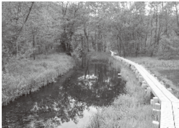
池河内湿原と木道