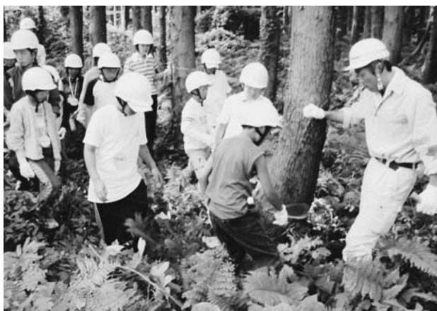
ジュニアフォレストサポーターの養成研修

今後も子どもたちに対して、魅力ある森林環境教育を行い、多様な森林体験の機会を提供しながら、将来、福井県の森林・林業を担う後継者、指導者として活躍してもらうことを期待しています。