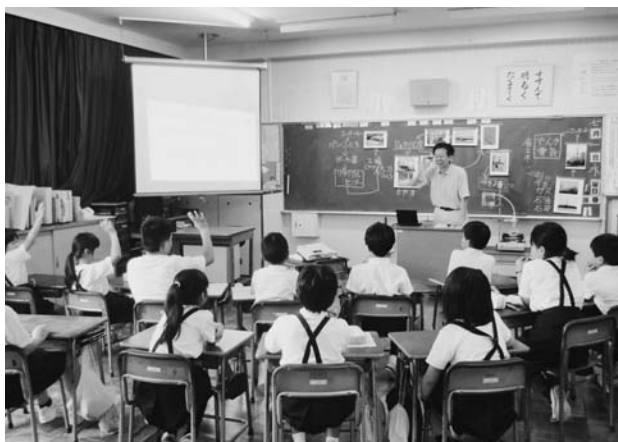
環境アドバイザーによる学習会

表4-1-1のとおり、派遣件数は増加しており、この制度により県民の環境問題への関心や環境保全に対する取組みの意識が高まっています。