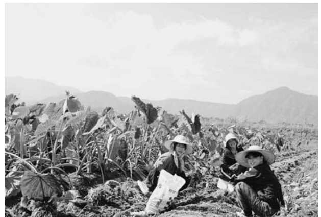
ふるさとワークステイに参加した若者達

平成21年4月から「ふくいエコ・グリーンツーリズム・ネットワーク」や各地域団体に「都市農村交流員」を配置しています。都市と農山漁村をつなぐコーディネーターとして、若者の誘致活動、農山漁村における受入のサポート、地域資源を活用した交流ビジネスの開発などに活躍しています。