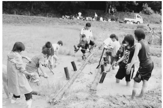
ビオトープ作り（エコキャンプ）

今後、県では、平成20年に策定した環境基本計画の「環境を思い行動する人づくり」において、エコ・グリーンツーリズムに資するコーディネーターやインストラクターなどの人材の育成、福井の自然の全国発信、エコ・グリーンツーリズムの実施団体との広域連携などを強化していくこととしています。