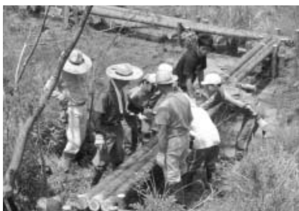
活動の実施状況（ビオトープの木道設置）