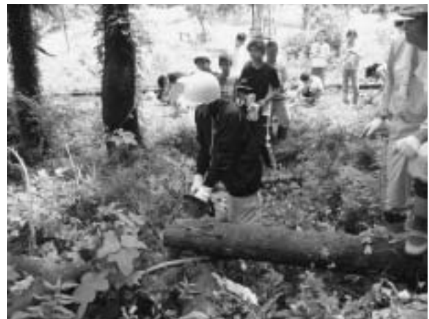
ジュニアフォレストサポーターの養成研修

今後も子どもたちに対して、魅力ある森林環境教育を行い多様な森林体験の機会を提供しながら、将来は福井県の森林・林業を担う後継者、指導者として活躍してもらうことを期待しています。