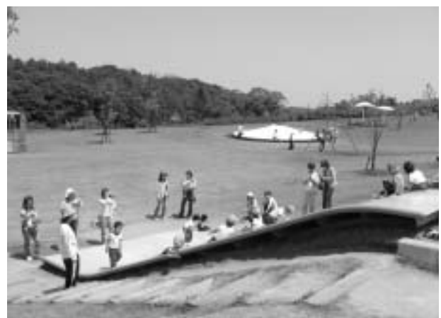
トリムパークかなづ

本県における都市公園整備状況は、平成18年3月末現在、13市町（9市4町）において開設数660か所、面積1,081.38haとなっています。都市計画区域内人口一人当たりの面積は、14.65㎡（全国平均9.1㎡）であり、全国7位の整備水準です。