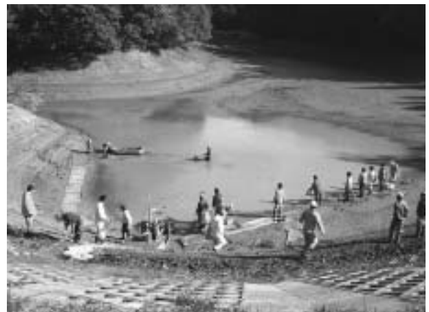
地域共同による農業用ため池の環境保全活動 (平成18年10月 あわら市後山)

こうした状況の中、資源の保全活動を地域ぐるみで行うモデル的な取組みが始まっています。平成18年度は県内10地区（16活動組織）の各活動組織が地域資源の保全や農村環境の向上に取り組んでいます。