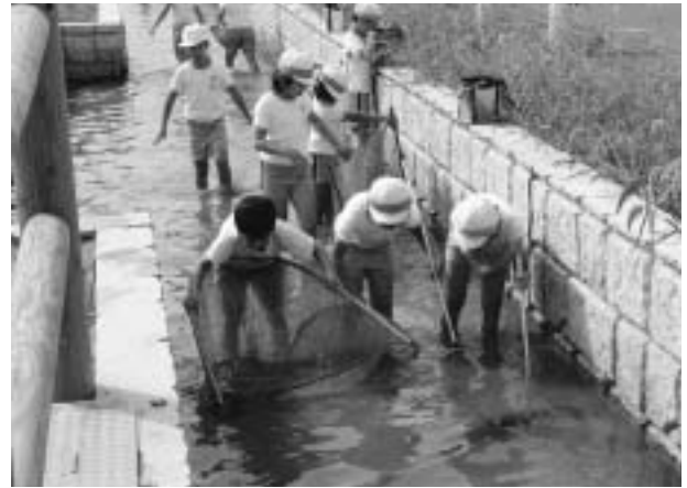
おさかなステーションでの環境学習 (福井市清明小学校)

ステーション設置後、水路に魚等の生き物が増加し、地元小学校などの環境学習の場にも利用されています。