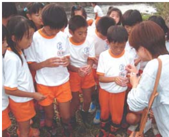
五味川の水質調査

一方で近年、遊味岡クラブという市民グループが中心となって、この味岡山を憩いの場にしようと里山再生プロジェクトが進められているところです。そこで本校児童達もこの取組みに協力しようと、3年生はドングリの苗を育て植える計画を着々と進め、4年生は五味川の清掃活動と水質調査を行っています。5、6年生はクリやドングリの植樹および巣箱掛け、清掃活動と自然に対して能動的な活動を行っています。また、今年度から味岡山を活用して自然のすばらしさを児童達に体験させようと、PTA事業「四季の味岡山、親子活動」「五味川ホタル観察会」も実施されています。