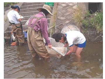
ハス川での魚類調査

昨年から力を入れて活動しているのは、「湖の恵み発掘調査」です。これは、地域の人たちが忘れかけた湖の恵みを再発見し、それを次の世代にも伝えることで、地域の人たちが湖を思う気持ちを再生し、さらには豊かな自然を取り戻す行動に移すことをねらったプログラムです。この活動からは、たくさんの淡水魚文化が再発見されつつあります。