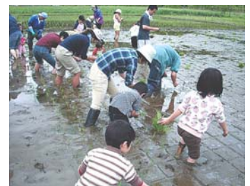
生きもの豊かな田んぼづくり

コイ、フナの子刺身の人気が高いこと、シジミを捕って食べていたことなど。地域の人々の力で豊かな水辺環境が再生できるよう、活動を継続したいと思います。