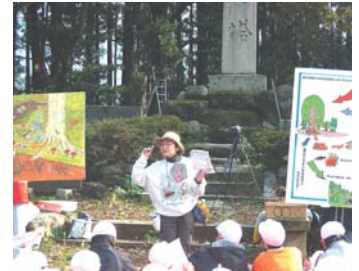
森林インストラクターと観察会

一方で近年、遊味岡クラブという市民グループが中心となって、この味岡山を憩いの場にしようと里山再生プロジェクトが進められているところです。そこで本校児童達もこの取組みに協力しようと、3年生はドングリの苗を育て植える計画を着々と進め、4年生は五味川の清掃活動と水質調査を行っています。5、6年生はクリやドングリの植樹および巣箱掛け、清掃活動と自然に対して能動的な活動を行っています。また、今年度から味岡山を活用して自然のすばらしさを児童達に体験させようと、PTA事業「四季の味岡山、親子活動」「五味川ホタル観察会」も実施されています。