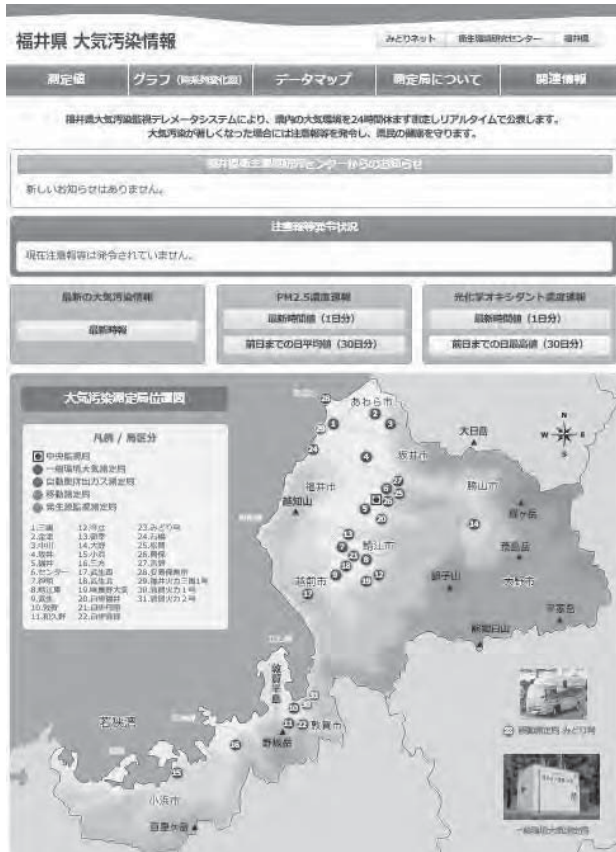
図 2 福井県大気汚染情報 (トップページ) ( http://www.erc.pref.fukui.jp/tm/ )