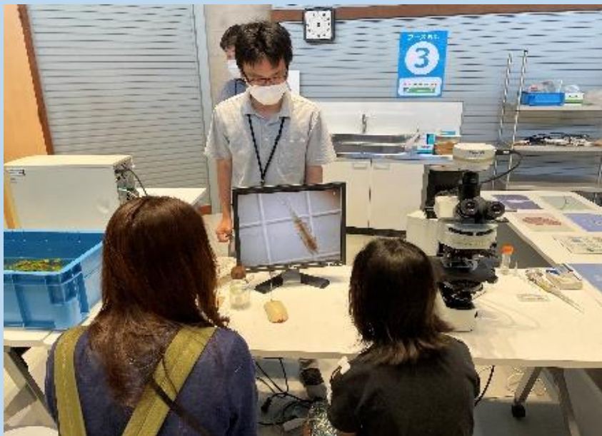
顕微鏡でプランクトン観察