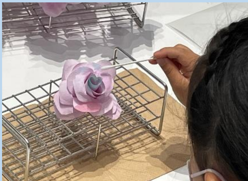
ペーパーフラワー