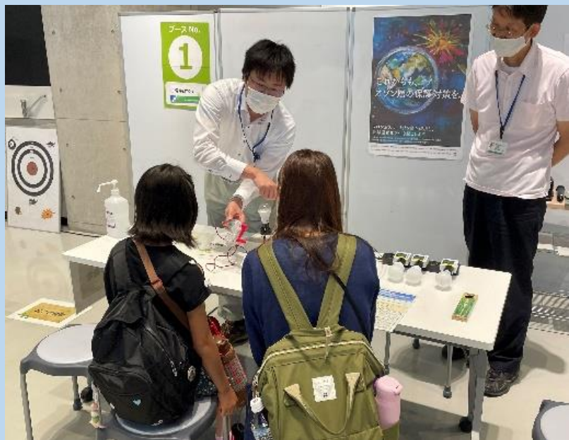
手回し発電(電球比較)