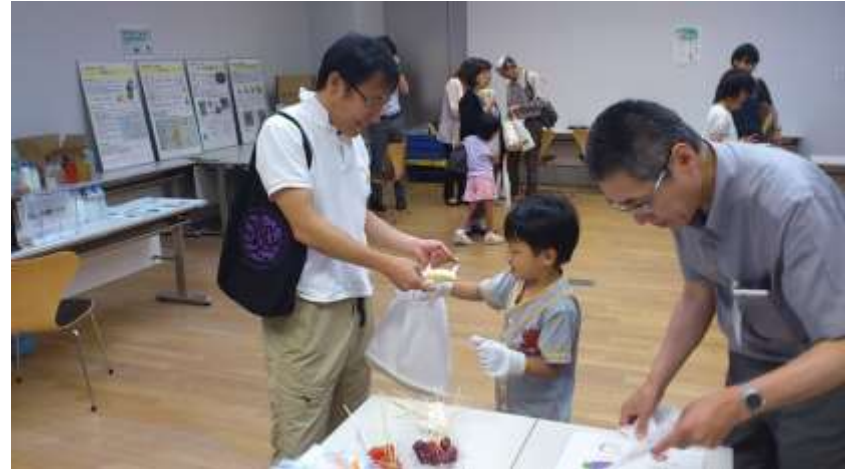
<体験コーナー全景>