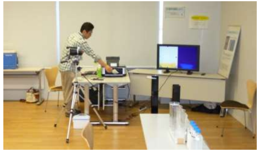
<サーモカメラ撮影>