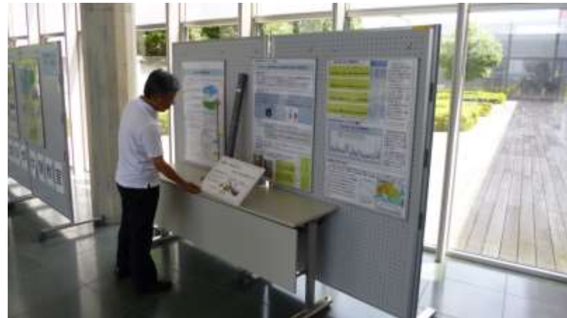
<研究紹介パネル展示>